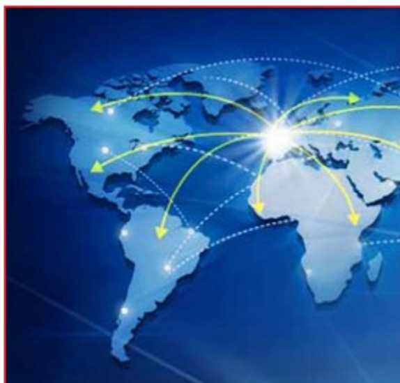
CONQUERIR DE NOUVEAUX MARCHES A L'INTERNATIONAL